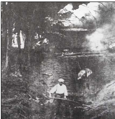
Séchoir de la tuilerie de la Bourge

Pays de pierre calcaire et de poches argileuses, la commune de Lavoux utilisera très tôt ces ressources pour installer des tuileries et fours à chaux.