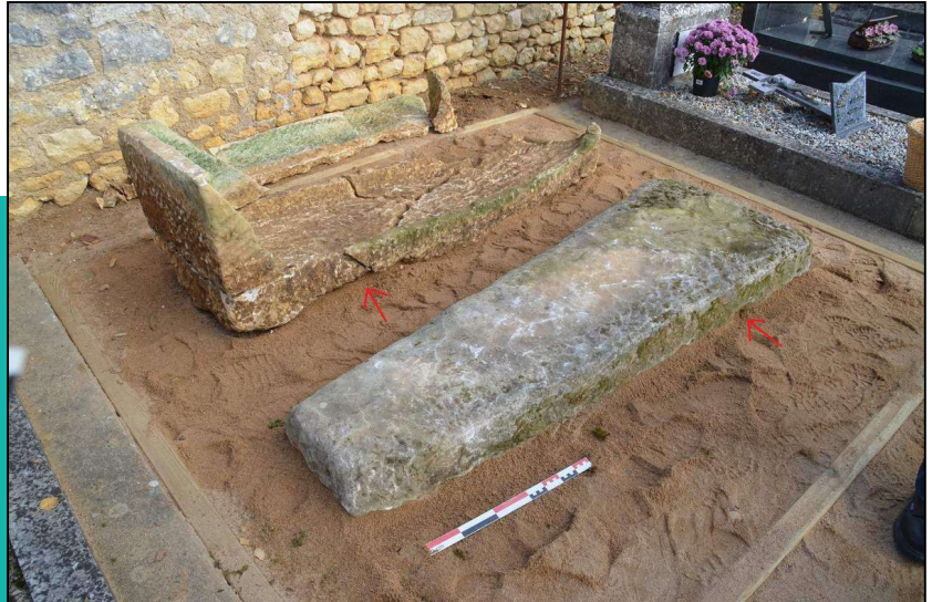
Le sarcophage des Grèles reconstitué.

Un squelette, très mal conservé a été retrouvé en position primaire. L'examen anthropologique a mis en évidence plusieurs déplacements osseux et ruptures d'articulations témoignant d'une décomposition en espace vide.