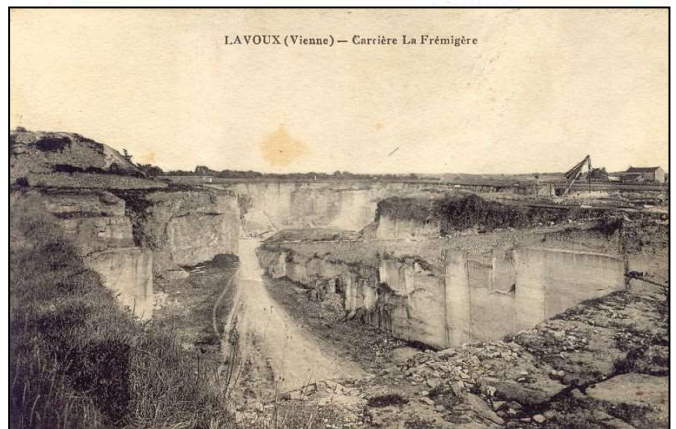
Carrière de la Frémigère

Afin de mener à bien ce vaste chantier les besoins en pierre de taille sont colossaux. De nombreuses carrières sont alors ouvertes dans la Vienne. Celles de Lavoux voient ainsi le jour. La qualité spécifique de la pierre qui y est extraite fait rapidement sa renommée.