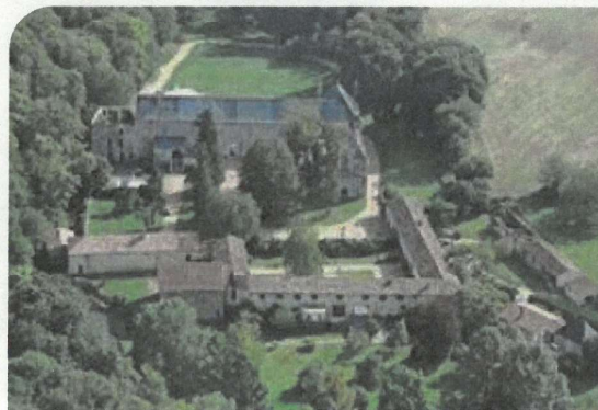
L'Abbaye du Pin à Béruges

Sur cette boucle de 130 km, vous allez pouvoir allier technicité, endurance et relance au travers d'un patrimoine varié et magnifique pour les vététistes, ultra-traileurs et marcheurs confirmés.