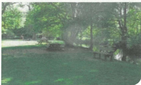
Bord de Boivre à Biard

La totalité du circuit est signalé par des bornes en bois numérotées 1, pouvant se pratiquer dans les deux sens afin de vous offrir des paysages différents selon les saisons, depuis l'une des villes nommées.