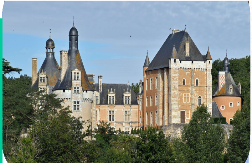
Château privé de Touffou