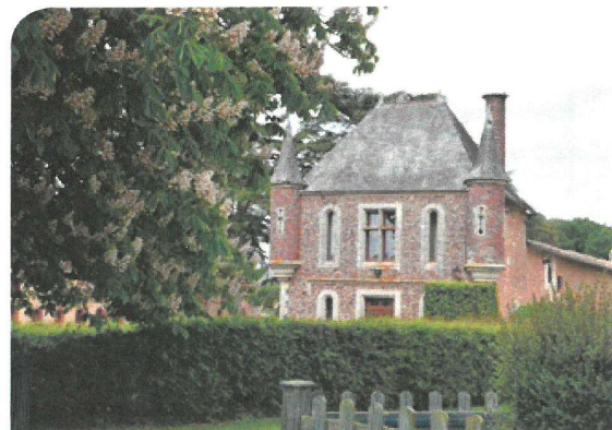
Le château de la Raudière.

L'église inachevée est ouverte au culte en 1888. Les sculptures des chapiteaux ne sont terminées qu'en 1893 et le clocher ne sera jamais construit.