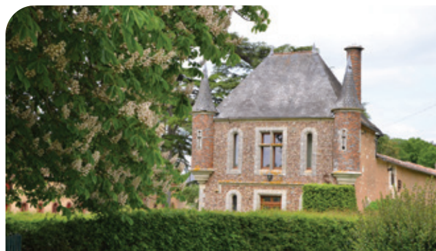
Le château de la Raudière

L'église inachevée est ouverte au culte en 1888. Les sculptures des chapiteaux ne sont terminées qu'en 1893 et le clocher ne sera jamais construit.