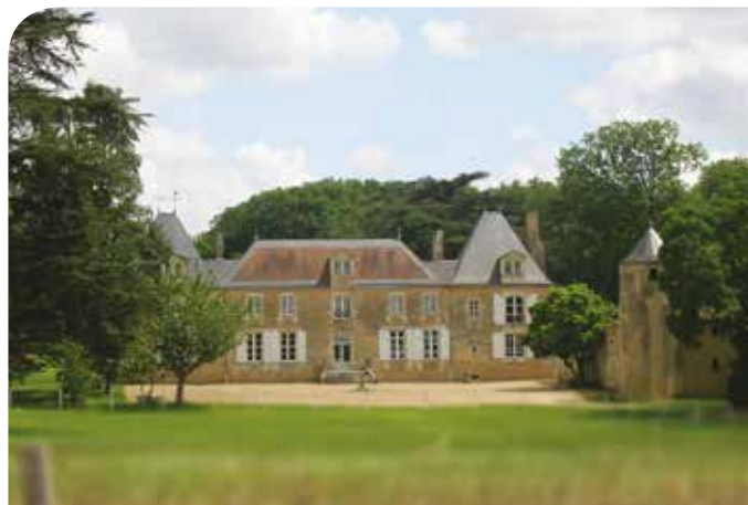
Le château de la Cigogne

● Sainte-Jeanne est une ancienne ferme dépendant de la Cigogne, en référence à Jeanne d'Arc. On peut y voir le blason de celle-ci.