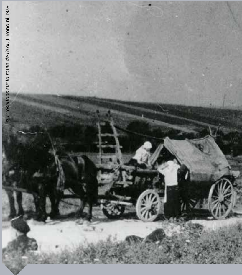
© Mosellans sur la route de l'exil, J. Rondini, 1959