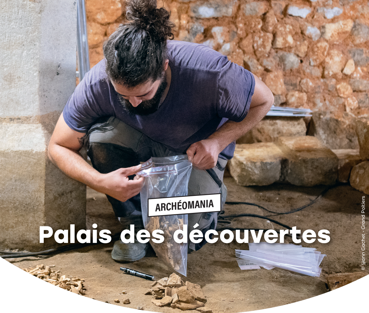
© Yann Cachet - Grand Poitiers