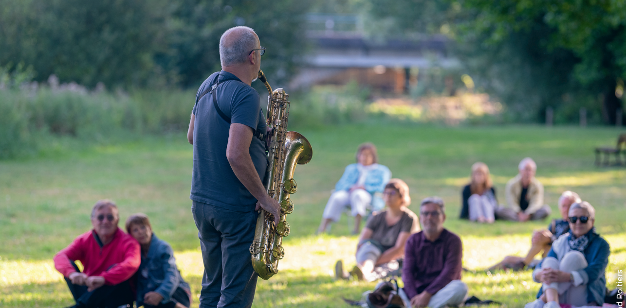
© Yann Gachet - Grand Poitiers