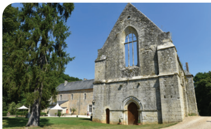
Abbaye du Pin

● Le moulin autrefois appelé du Gué-des-Roches , mentionné en 1573, dépendait autrefois de la Commanderie de l'Épine. Il apparaît sous le nom de Jean Moulin sur le