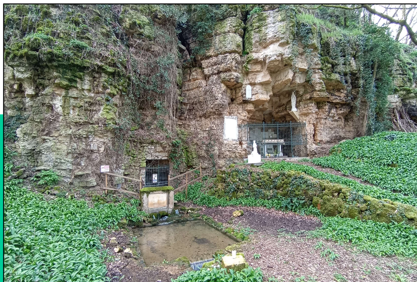
Grottes de Malvaux

Dans cette pittoresque vallée de la Vonne, les sources sont nombreuses. L'une d'elles, la source de Malvaux, a été aménagée en sanctuaire en 1898. Tous les ans, un pèlerinage, "Le Lourdes en Poitou", a lieu le 2e dimanche de juillet