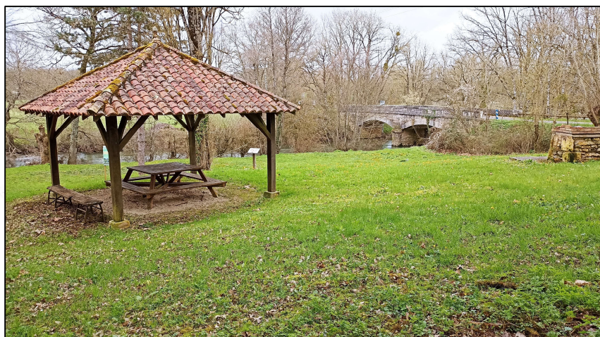
Aire de pic-nic et pêche pont de Leignes