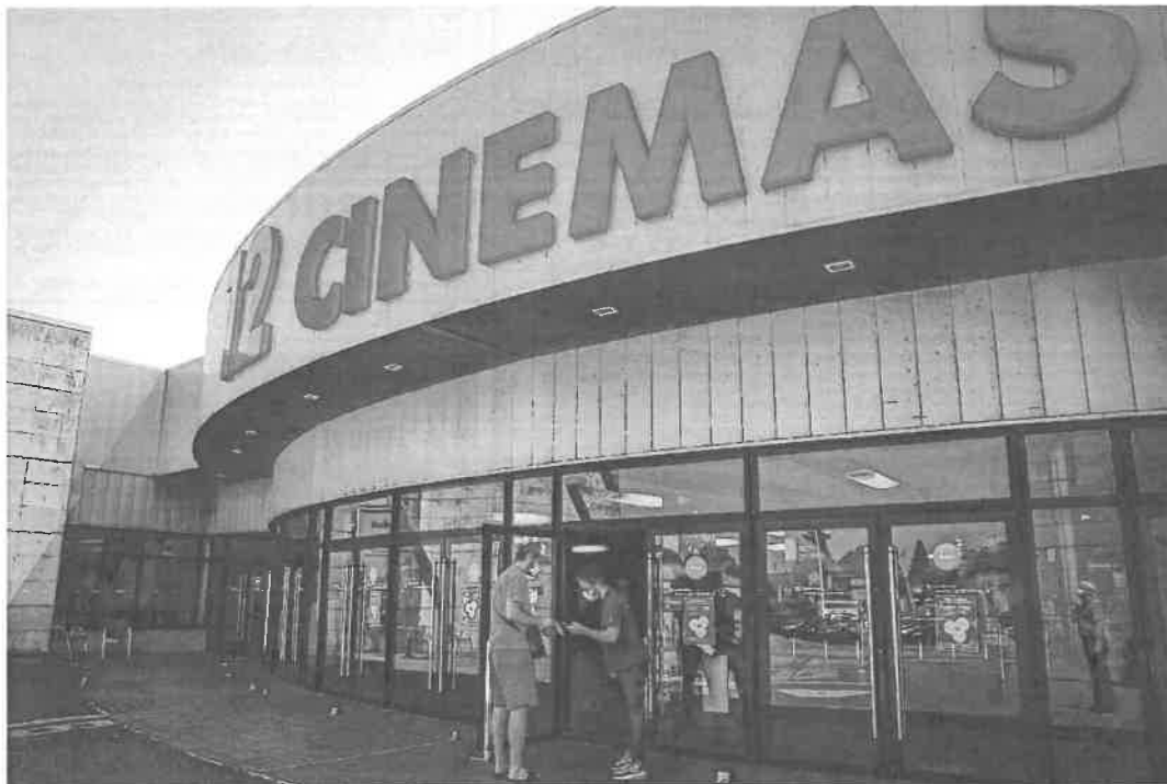
Rentrée catastrophique pour les cinémas de la Vienne qui enregistrent jusqu'à 35 % de spectateurs en moins.

ANTOGNY-LE-T. À contresens sur l'A10 : un choc mortel