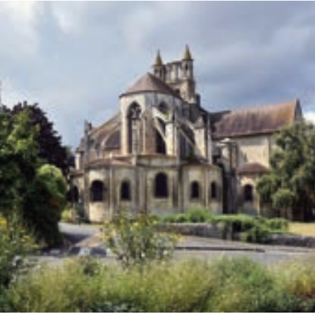
L'église Saint-Jean de Montierneuf