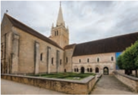
L'abbaye de Saint-Benoît