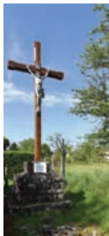
Le Pas de Saint-Jacques