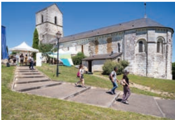
Le prieuré de Saint-Léger-la-Pallu