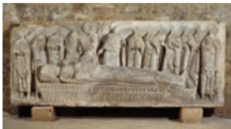
Le cénotaphe de saint Hilaire