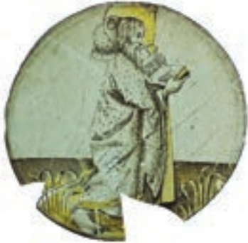
Saint-Jacques-le-Majeur, fin XV e - début XVI e siècle, grisaille sur verre et jaune d'argent