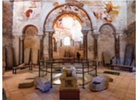
Le baptistère Saint-Jean

Caractéristique du grand gothique « de France », la façade occidentale reprend l'ordonnance des cathédrales du Nord de la France. Encadrée par deux grosses tours, la façade se compose de trois grands portails sculptés, réalisés au cours du XIII e siècle et correspondant aux trois vaisseaux intérieurs. Elle est célèbre grâce à son décor : le vitrail de la Crucifixion, un des plus anciens de France (vers 1160) et ses peintures murales datant de la fin du XIII e siècle qui témoignent de la richesse du commanditaire. Deux autres chefs-d'œuvre sont également remarquables : l'orgue Clicquot, terminé en 1791, et les stalles du XIII e siècle (sièges de bois à dossier élevé).