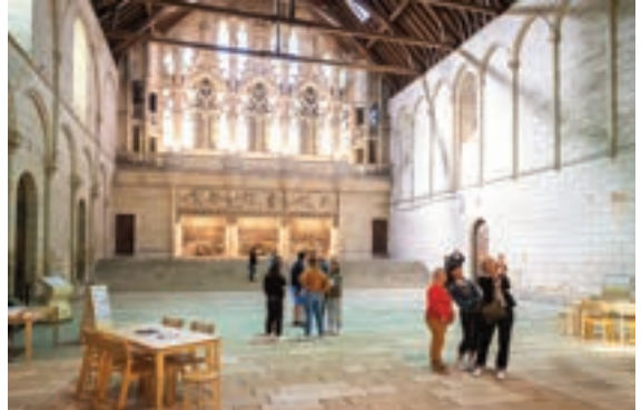
La salle des Pas Perdus du Palais