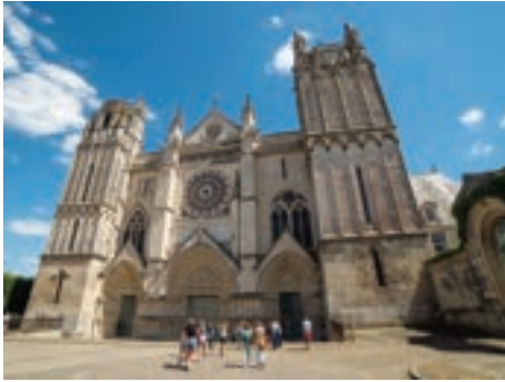
La cathédrale Saint-Pierre