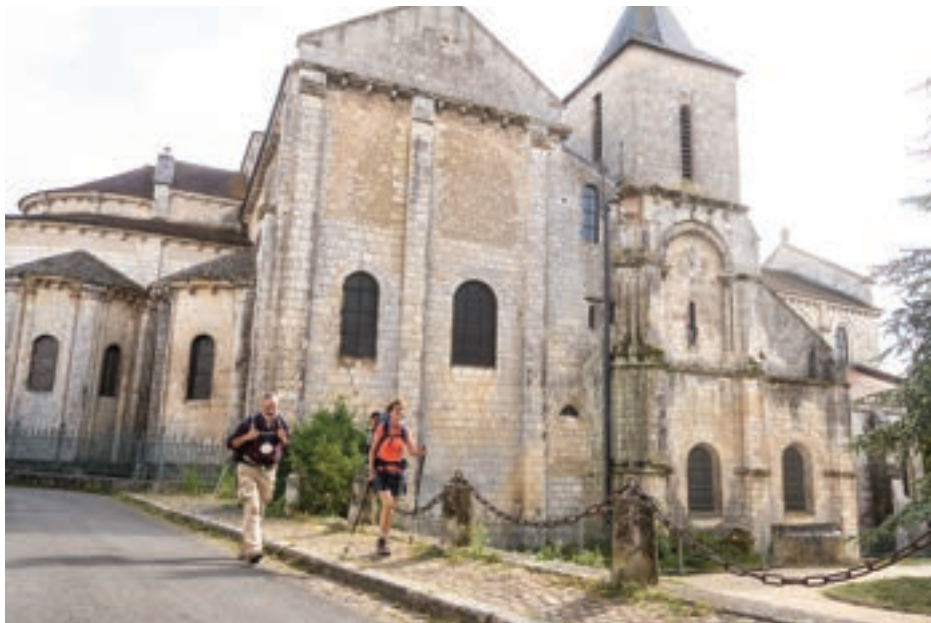
Pèlerins devant l'église Saint-Hilaire-le-Grand à Poitiers