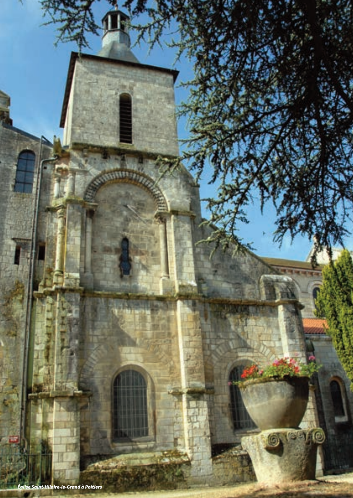
Église Saint-Hilaire-le-Grand à Poitiers