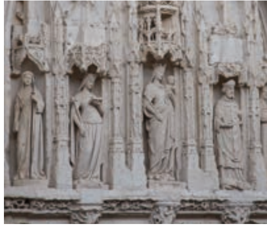
Eglise Sainte-Radegonde, détail du portail d'entrée

Construite à la fin du XI e siècle, l'abbaye de Montierneuf, littéralement du « Moustier neuf » (monastère neuf), donnera son nom au bourg prévu, décidé et organisé par le duc en même temps que la fondation de l'abbaye. Dès sa fondation, l'abbaye est rattachée à Cluny. L'ampleur du magnifique chevet et du transept, édifiés au XI e siècle, rappelle l'importance de cette prestigieuse abbaye, lieu de sépulture de son fondateur.