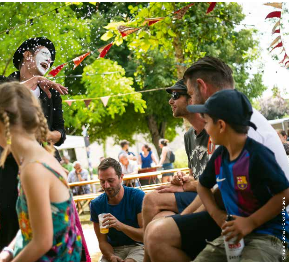
© Yann Gachet - Grand Poitiers