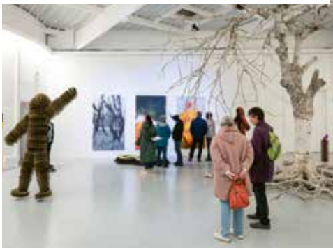
© Yann Gachet - Grand Poitiers

À Rouillé, Rurart propose des expositions d'art contemporain en milieu rural et au sein du lycée agricole.