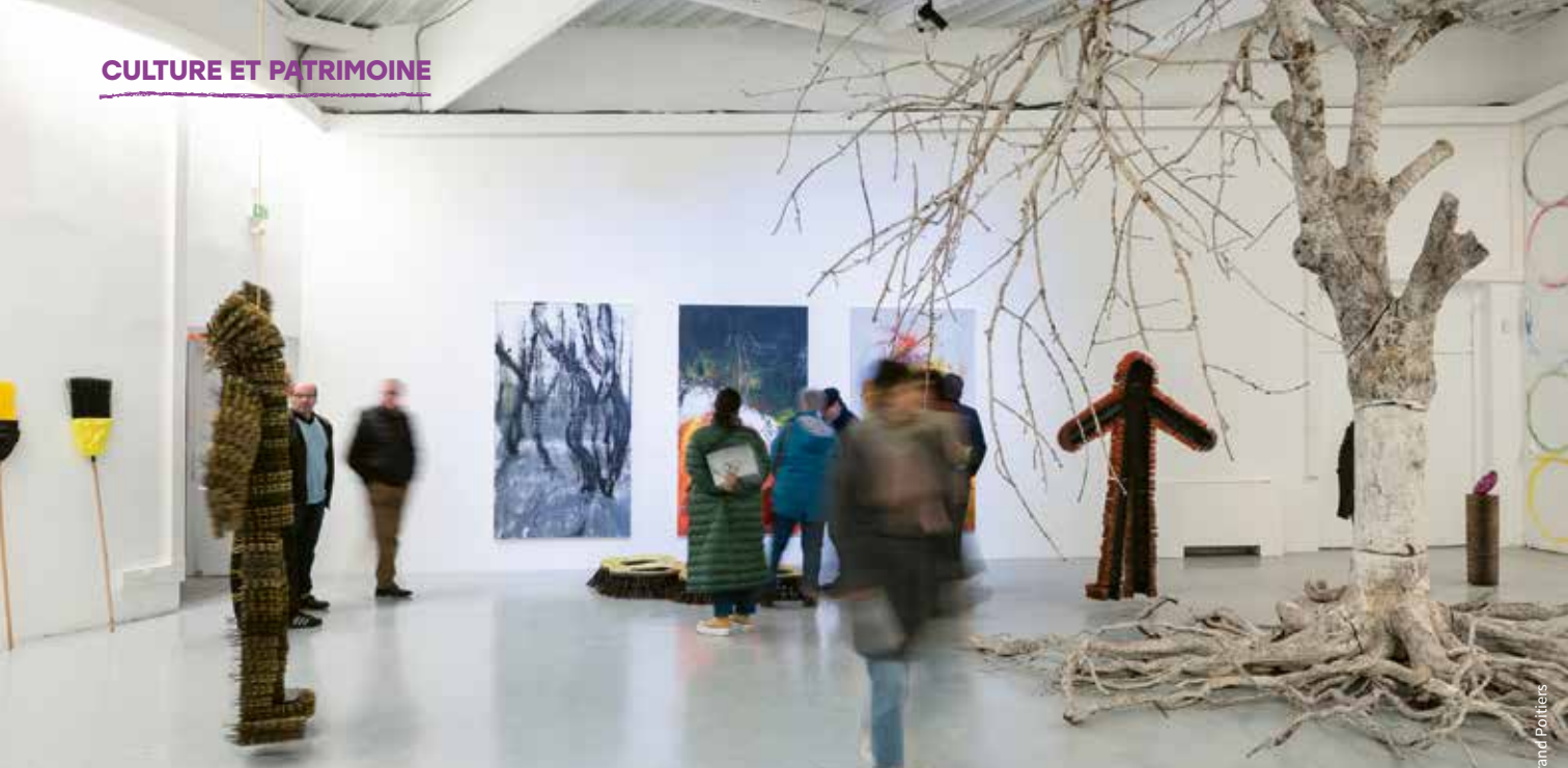
© Yann Gachet - Grand Poitiers