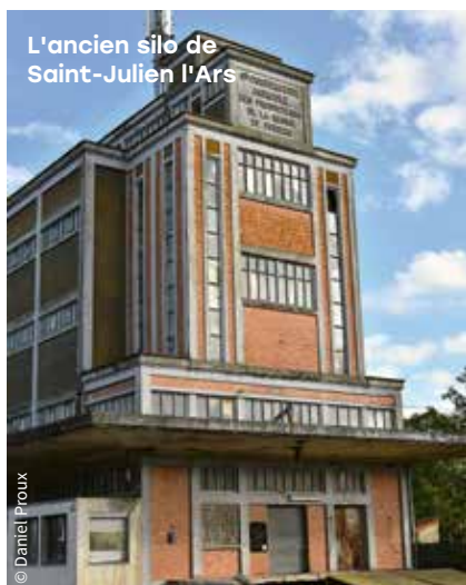
L'ancien silo de Saint-Julien l'Ars

Une vaste opération de reconversion a déjà été menée sur le site occupé jusqu'en 2014 par Federal Mogul, à Chasseneuil-du-Poitou. Grand Poitiers s'est portée acquéreur de la totalité du foncier, soit plus de 7 hectares. Après avoir dépollué et transformé le site sur 4,6 hectares, Forsee Power y a installé en 2022 son usine ultramoderne de systèmes de batteries pour transports collectifs, devenant locataire de Grand Poitiers. La surface restante - 2,6 hectares qui correspondent à l'ancienne fonderie - fait l'objet actuellement d'une complexe opération de dépollution menée par la communauté urbaine avec l'aide du fonds friches et de l'Ademe.