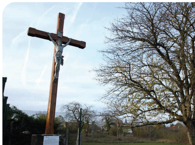
La Croix Mériot

La vallée est classée en Zone nationale d'intérêt écologique faunistique et floristique (ZNIEFF de type I). Elle constitue une magnifique coulée de nature à proximité du tissu urbain. Cette biodiversité constitue un véritable patrimoine écologique, riche de nombreuses espèces rares et protégées (astragale de Montpellier, différentes sortes d'orchidées, nombreuses espèces de papillons et autres insectes, mammifères).