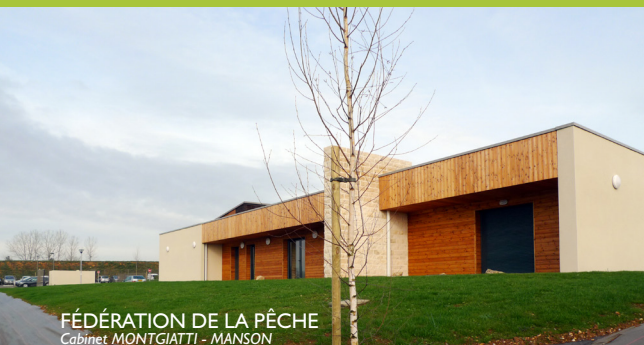
FÉDÉRATION DE LA PÊCHE Cabinet MONTGIATTI - MANSON

Le parc d'activités, en tant que composante du quartier des Montgorges, obéit également à des exigences de qualités architecturale, environnementale et d'intégration au site. Les bâtiments à l'architecture contemporaine affirmée s'intègrent de façon cohérente, dans des aménagements et espaces paysagers de qualité.