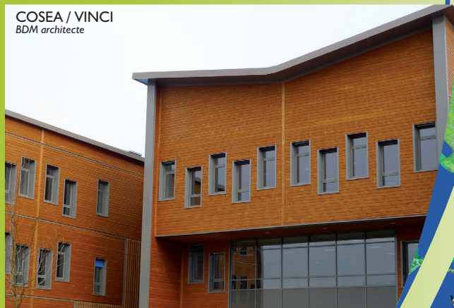
COSEA / VINCI BDM architecte

Aujourd'hui, la totalité des lots est commercialisée et certains des bâtiments ont été livrés en 2011. Parmi les principales entreprises figurent des concessionnaires autos (Honda et Fiat), un village motos, Tourteaux Jahan, Debiais (magasin de meubles), plusieurs immeubles de bureaux (Soregor expert comptable, la Fédération de la pêche, MOCA) dont un vaste ensemble immobilier pour la Société COSEA (Groupe VINCI).